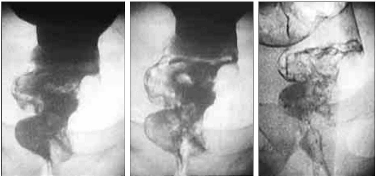
Мал. 5. Прицільні іригограми прямої кишки у фази тугого заповнення та подвійного контрастування. По лівому контуру середньо- та нижньоампулярного відділів прямої кишки визначається крайовий дефект наповнення з депо контрасту та зі звуженням кишки на 1/3. Висновок: екзофітний рак прямої кишки (туберозна форма) із роз'ятренням

щої візуалізації змін застосовували тонове коригування зображення за допомогою команд «Levels» та «Brightness/Contrast», інколи — «Curves», що істотно поліпшувало якість. Зауважимо для порівняння: якщо отримують неякісну звичайну рентгенограму (через неправильні експозицію, показники напруги, сили струму), потрібно переробляти знімки, що збільшує променеве навантаження на пацієнта.