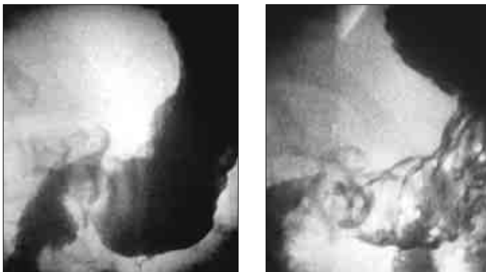
Мал. 3. Рентгенограми цибулини дванадцятипалої кишки у вертикальному та горизонтальному положеннях. Визначається стійке депо контрасту на рельєфі цибулини, конвергенція складок слизової оболонки, деформація цибулини. Висновок: виразка цибулини дванадцятипалої кишки