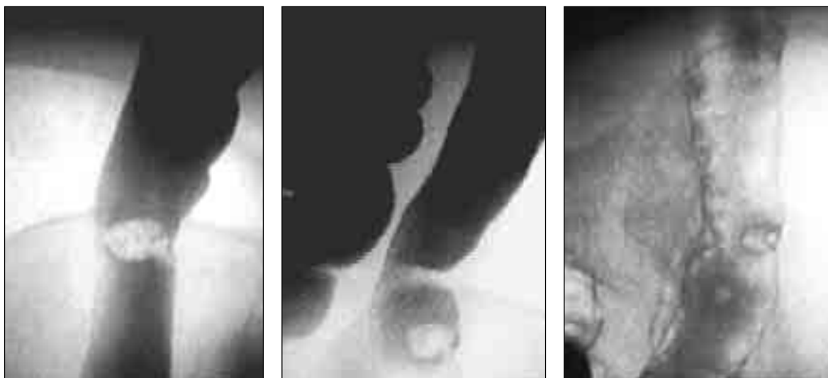
Мал. 4. Прицільні іригограми низхідної кишки у фазі тугого заповнення та подвійного контрастування. На зовнішньому контурі кишки визначається крайовий дефект наповнення на ніжці заввишки до 1,0 см. Висновок: поліп низхідної кишки

спазм — у 3, гіпотонія шлунка — у 7, рефлюкси — у 39, недостатність баугінієвої заслінки — у 103); запальні процеси (езофагіт — у 15 хворих, гастрит — у 84, коліт — у 106); аномалії розвитку — у 5 хворих; діафрагмову килу — у 17 хворих, дивертикульоз тонкої кишки — в 11, товстої кишки — у 23 хворих. Серед пухлинних захворювань визначено доброякісні новоутворення (у наших спостереженнях — поліпи) стравоходу (2 хворих), шлунка (5) та товстої кишки (7). Серед злоякісних пухлин системи травлення визначено у більшості випадків рак шлунка (87 хворих), рак товстої кишки (104), рак стравоходу (6). Зрідка визначали вторинне ура-